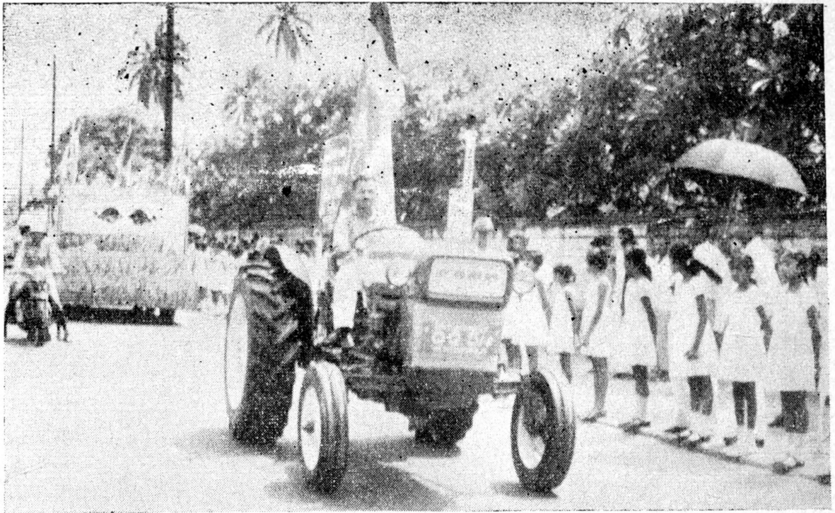
දිනු සමාජය හා ට්‍රැක්ටර් යන්ත්‍රයද මොරටුව පාලමේ සිට කළුතර දක්වා පෙරහරින් කැඳවාගෙන ගිය අයුරු. කළුතර දිසාපති විසින් මෙම පෙරහැර සංවිධානය කරන ලදී. ගොවි පය හඬ උළෙලේදී කැමරාවට මුහුණ දුන් කඩවසම් තරුණ ගොවි ගෙවිලියෝ.