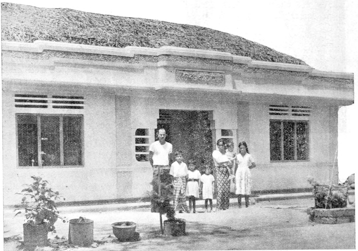
ගොවි මහතා සිය දරුවන් සමඟ

සමාජ ජීවිතය මෙන්ම සමාජ සේවයද ප්‍රිය කරන රත්නයක මහතා පළාතේ සමිති සමාගම්වල නිලතල රැසක්ද උසුලයි. ගොවි තැනෙන් සිය දිවිය යහමගට හරවාගත් අපේ මේ වීර ගොවියා සැබවින්ම ආදර්ශමත් ගොවියෙකි. පළාතේ සෙසු ගොවීන්ද ඔහුගේ ආදර්ශය අනුගමනය කරන්නේ නම් ඔවුන්ටද ගොවිතැනෙහි නියම රසාස්වාදය ලබාගත හැකිවනු නිසැකය.