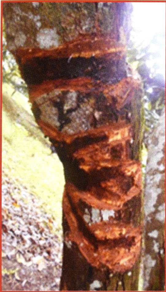
පළිබෝධකයා කඳේ පොත්ත තුළ උමං භාරමින් පොත්ත කා දමයි

දුරියන් යනු වර්තමානයේ ඉතාමත් ප්‍රචලිත වෙමින් පවතින වැදගත් පලතුරක් වන අතර එය ආර්ථික වශයෙන්ද ඉතා වාසිදායක බැවින් වගා කිරීමට ගොවි මහතන් පෙළඹී ඇත. මෙම වගාව ප්‍රචලිත වීමත් සමග දැනට මෙතෙක් බහුලව නොතිබූ පළිබෝධ හා රෝග වර්තමානයේ දක්නට ලැබේ. මෙම තත්වය අනුව දැනට නිතර ගොවි මහතන්ගේ කේන්ද්‍ර වල භාවිතා වෙමින් පවතින ප්‍රධාන පළිබෝධකයෙක් පිළිබඳ විස්තර දැනුවත් කිරීම වැදගත් වේ.