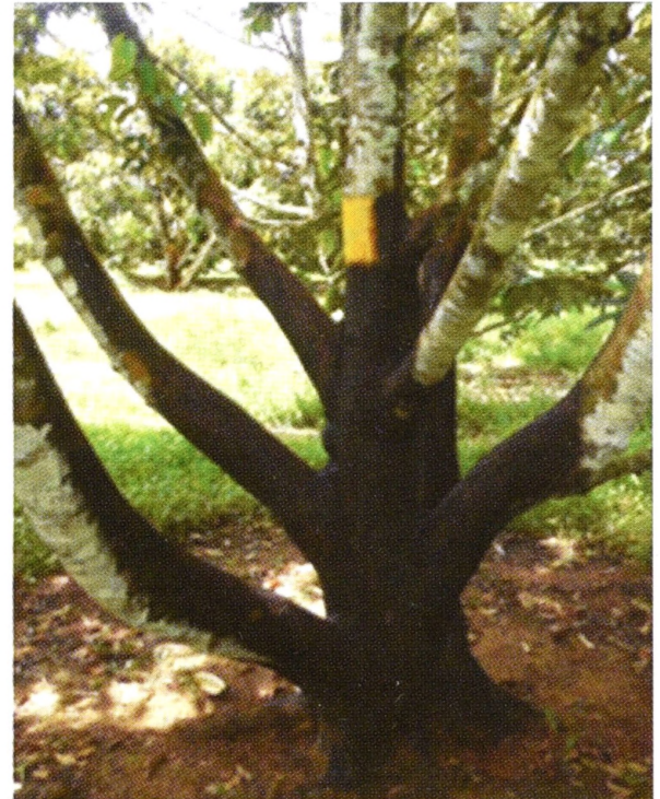
ගසේ මතුපිට කුරුට්ට කොටස ශුද්ධ කර කෘමිනාශක යෙදීම

කිරීම, සිදු කළ හැකිය. මීට අමතරව අලෝක උගුල් භාවිතා කර පරිනත කුරුමිණියා පාලනය කිරීම, නිතර නිතර ගස් පරීක්ෂාවට ලක් කොට කිටයන් හානි කර ඇත්දැයි බලා ඔවුන් විනාශ කිරීම. කඳ ශුද්ධ කළ සෑම අවස්ථාවකටම කෘමිනාශක වලට අමතරව කැන්ඩසාන් වැනි දිලිර නාශකයන් අලේප කිරීම වැදගත් වේ. වගාව පිළිබඳ නිරන්තර අධීක්ෂණය ඉතාමත් වැදගත් වේ. අඛණ්ඩව කෘමිනාශක යෙදීම මෙහිදී අවශ්‍ය වේ.