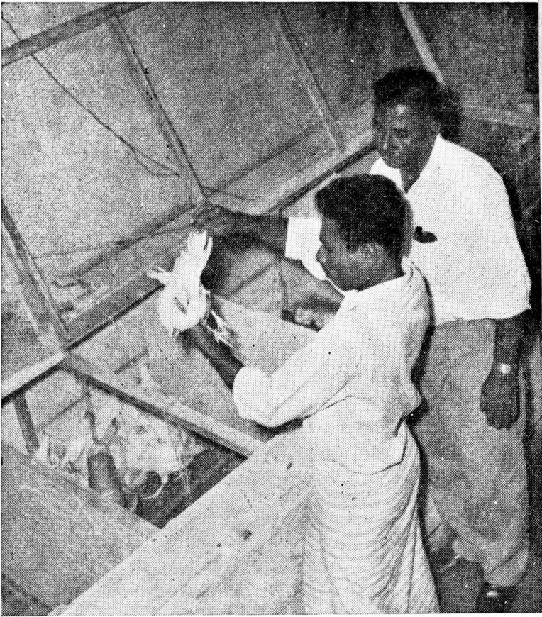
දෙමස් වයස් පැටව හා කුකුළු බිත්, උපකරණ ආදිය

“ 1959-60 ශාස්ත්‍රාලයීය වර්ෂයේදී භෞරණ ප්‍රායෝගික ගොවි පාසැලේහි පුහුණුව ලබා , 1960 මාර්තු මාසයේදී මා පාසැලෙන් පිටවීම්. පාසැලෙන් පිට වූ නොබෝ දිනකින් මා නැවත කුකුළු පාලනයට පා තැබුවෙමි. එසේ සඳහන් කරන්නේ මා ගොවි පාසැලට යෑමට පෙර ද කුකුළන් ඇති කිරීම කළ බැවිණි. දෙවන අවස්ථාවේ ආරම්භ කළ මගේ ව්‍යාපාරය දිනක් වයස් වැඩිවීමෙන් පැටවුන් 30 න් පටන්ගත් එකකි. එය