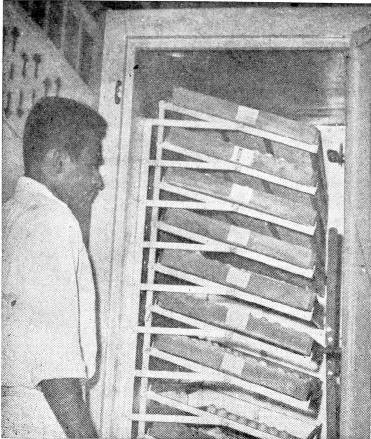
බිත්තර රක්කවන විශාල යන්ත්‍රය හා එයින් පිටවූ පැටවුන්