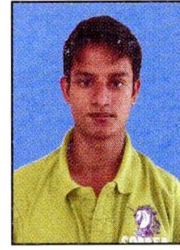
උප භාණ්ඩාගාරික : එච්. ජී. ඩී. ඊණානුංග