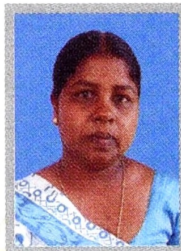
කෘ.ප.ති.ස. : යූ. ආර්. චන්දනි කුමාරී

තරුණ ගොවි සමාජ මූලස්ථානයේ මූලස්ථාන කෘෂිකර්ම උපදේශක ආර්. ඒ. පී. කේ. රත්දෙනිය මහතාට ගොවිකම් සඟරාවේ අපි විශේෂ ස්තූතිය පුදකර සිටිනවා