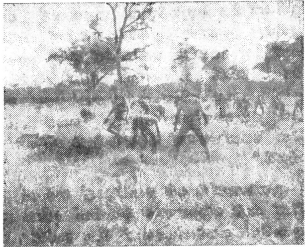
ඉවත් හමුදා හටයින් විසින් අක්. 65 ක සාරවත් ලෙස වගාකර තිබූ ගොයමේ අස්වැන්න තෙලද්දි.

ගැනීමට හැකිවුණා. පසුගිය අවුරුද්දේ ජූලි 1 දා වැඩ ඇරඹූ මේ ගොවිපලේ දැනට ආහාර බෝග වර්ග රාශියක්ම වගාකර ඇති අතර, මෙම වැඩ කරනු ලබන්නේ තරුණ විශේෂ පසුවන ස්වේච්ඡා හටයින් 39 දෙනෙක් විසිනුයි.”