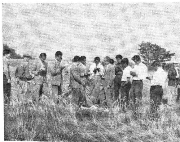
වී ගොවිකෑන ගැන ඉගෙන ගැනීමට දේ එමට තිබේ