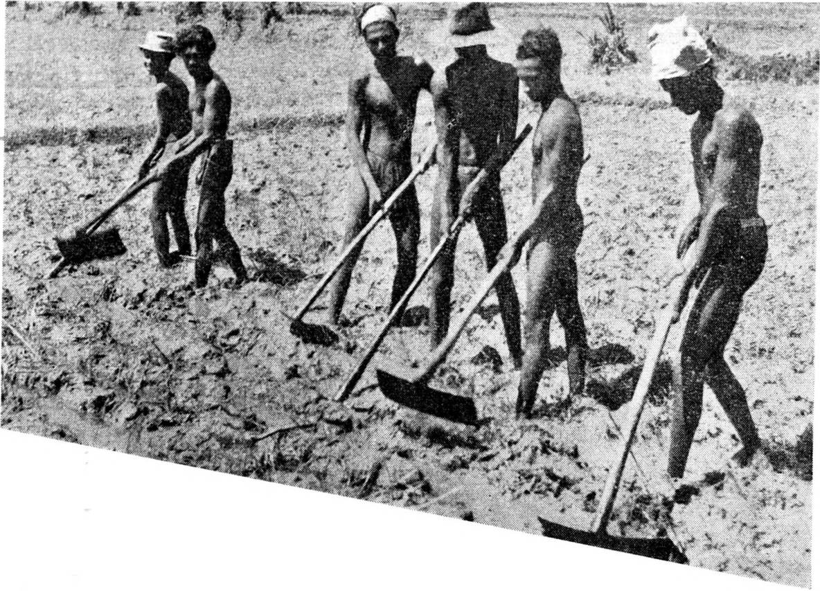
සිය සගයන් සමග

යොදන ලදී. ගොයම මනාව පැසුණු පස පළාතේ පාර්ලිමේන්තු මන්ත්‍රීතු කුසුමා ගුණවර්ධන මැතිණියගේ ප්‍රධානත්වයෙන් අස්වැන්න ගණන් ගැනීමේ පරීක්ෂණයක්ද පැවැත්විණි. එම මූලික පරීක්ෂණයේදී කුඹුරු යායෙන් සාමාන්‍ය අක්කරයකින් බුසල් 65 ක අස්වැන්නක් ලැබෙන බව පෙනීගිය අතර කුඹුරෙහි මුදුමනින්ම ගොයම කපා අස්වැන්න රැස්කරගත් විට අක්කරයකින් බුසල් 96ක අස්වැන්නක් ලැබී තිබෙන බව පෙනී ගියේය. මේ වූකලී ප්‍රදේශයේ නිසරු කුඹුරකින් ලැබුණු උසස්තම අස්වැන්නකි. මෙතෙක් පනාවල් කෝරළයේ වී අස්වැන්න පිළිබඳව පිහිටුවා වූ උසස්තම වාර්තාවය. මුලදී අක්කරයකින් බුසල් 10ක අස්වැන්නක් ලැබුණු කුඹුරකින් එමෙන් නව ගුණයකටත් අධික අස්වැන්නක් ලැබුනේ නවීන ගොවිතැනේ මහිමයෙනි. පෝර යෙදීමේ අනුහසිනි. මේ රටේ නිෂ්පාදන වේගය වැඩිකොට රට සවයංපෝෂිත කිරීමේ පරම බලාපොරොත්තුව මුදුන් පමුණුවා ගැනීමේ ඒකායන මාර්ගය එයයි.