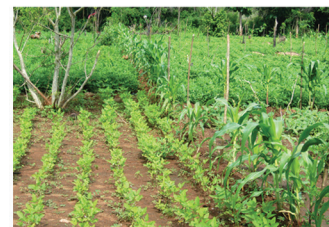
නිර්ජල/ විලු බෝග වගාව