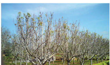
බහු වාර්ෂික බෝග වගා