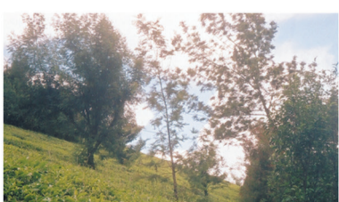
යුළං බාධක වැව්

යාන්ත්‍රික ක්‍රියා මගින්, ඉඩමේ බැවුම වෙනස් කිරීම හා බැවුමේ දිග අඩු කිරීම මගින් විසිරුණු පස් අංශු පර්වභනය හා තැන්පත්වීම පාලනයට වැඩි අවධානයක් යොමු කරනු ලැබේ. සාර්ථක ප්‍රතිඵල සඳහා නියමිත ප්‍රමිතීන්ට ඉදිකිරීම හා නඩත්තුව කෙරෙහි සැලකිලිමත් විය යුතුය.