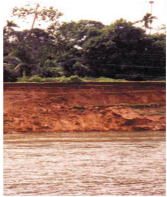
ගං ඉවුරු බාදනය