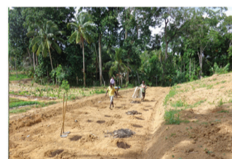
කාබනික පොහොර යෙදීම