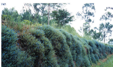
අච්චණ වගා (ඉවුරු)