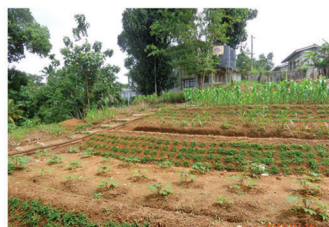
යහපත් ඉඩම් කළමනාකරණය