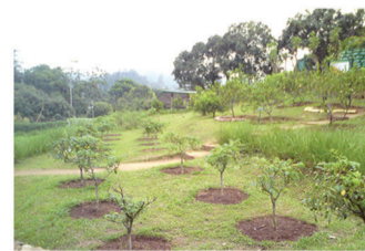
වර්ෂීය වල් වර්ධනය