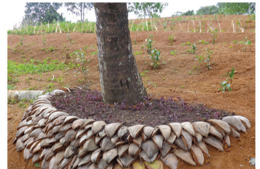
ඒකීය බිම් තට්ටු