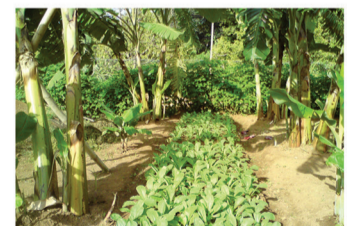
ස්ථරීය/ අතුරු බෝග වගාව