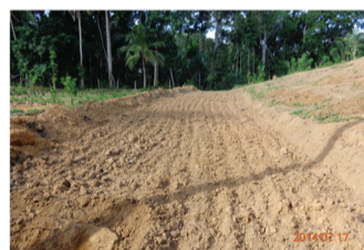
සමෝච්ච බිම් සැකසීම

යම් භූමියක වගා කිරීමට සුදුසු බෝගයක් තේරීමේ සිට අස්වනු නෙලීම දක්වා කාලය තුල කරනු ලබන සියළු කටයුතු පාංශු බාදනය අවම වන ලෙස කිරීම මෙයින් අදහස් වේ.