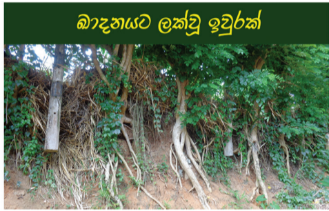
බාදනයට ලක්වූ ඉවුරක්