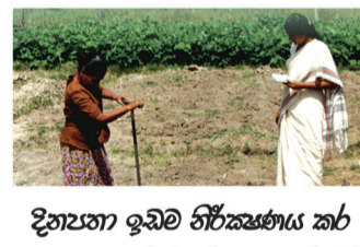
දිනපතා ඉඩම නිරීක්ෂණය කර අඩුපාඩු අත්හැරීම ඒවා සකස් කිරීම