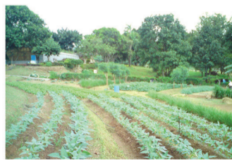
සමෝච්ච බෝග වගාව