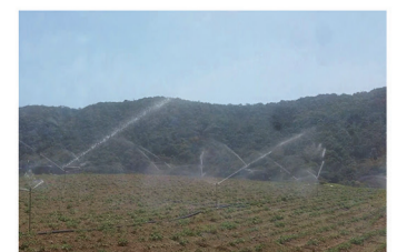
කපුදු පල සම්පාදනය