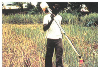
අවම බිම් සැකසීම