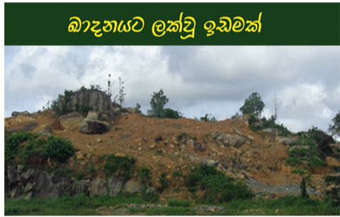
බාදනයට ලක්වූ ඉඩමක්