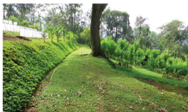
අච්චණ වගා (නෘණ)