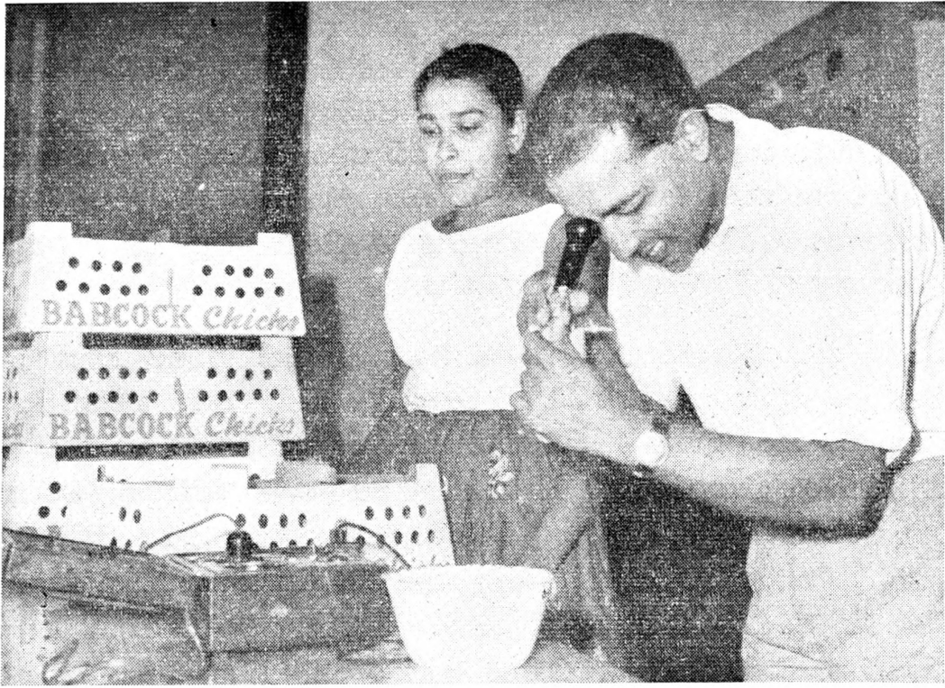
දිනක් වයස් පැටවුන් වර්ග කෙරේ

දැනට ගම්පොල ෂෙට්ටා ගොවිපලෙහි බිත්තර දමන කිකිළියන් 5,000ක් පමණ ඇත. එයින් දහසකට අධික සංඛ්‍යාවක් ඇති කිරීම සඳහා “රක්කවන බිත්තර ලබා ගන්නා සතුන්ය”. කෑමට බිත්තර ලබා ගන්නා කිකිළියන් වර්ෂයකදී 240කට අධික ගණනාවක් බිත්තර දමති. එම බිත්තර ගොවිපලේ සිට දිනපතා කොළඹට පටවා යවනු ලැබේ. කෑමට ගන්නා එම බිත්තර අලෙවි කරන්නේ එකක් ගත 22 ක් බැගින්ය. කෑමට ගන්නා බිත්තර අලෙවිය ෂෙට්ටා ගොවි පලේ විශාල කායඝීයක්වීද එහි ඉතා වැදගත්ම කටයුත්තවී ඇත්තේ දිනක් වයස් කිකිළියන් නිෂ්පාදනය කිරීමයි.