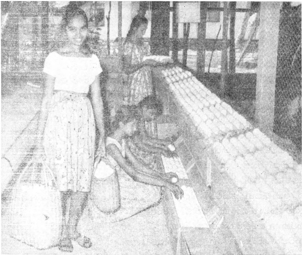
සමුපකාර කුකුළු ගෙවල කටයුතු සියල්ල ඉටුවන්නේ ක්‍රමානුකූලවයි

එහෙත් එකම “ඩීප් ලිටර්” ගෙයක බිත්තර දමන කිකිළියන් හා අළුත් වැඩෙන සතුන්ද දමා ඇති කිරීමට ඉඩකඩ නොමැතිවා මෙන්ම එය නොකට යුතු දෙයකි. ඒ අතර ඒ සඳහා වෙනම ගෙයක් සෑදීම කළ නොහැක්කකි. එමෙන්ම මෙම කාර්යය පැවරීමෙන් සාමාජිකයින්ට අතිරේක වගකීමක් හා වැඩි වැඩ කොටසක්ද ඇතිවෙයි. අස්කරන කිකිළියන් වෙනුවට අළුත් සතුන් සැපයීමේ කාර්යය සමිති සංගමයකට පවරා ගැනීමෙන් සාමාජිකයින්ට හා ඒ ඒ සමිති වලටද විශාල පහසුවක් ලැබෙන බව ප්‍රනාන්දු මහතාට පෙනී ගොස් ඇත. එබැවින්, මේ සඳහා මෙම සමිති පහ “සමිති සංගමයක් සේ” ලියාපදිංචිවී මහජන බැංකු ණයක් ලබා දිනක් වයස් පැටවුන් මිළ දී ගෙන උන් බිත්තර දමන තෙක් ඇති කර ඒ ඒ සමිතිවල මාර්ගයෙන් ඒවායේ සාමාජිකයින්ට විකිණීමට නියමිතය.