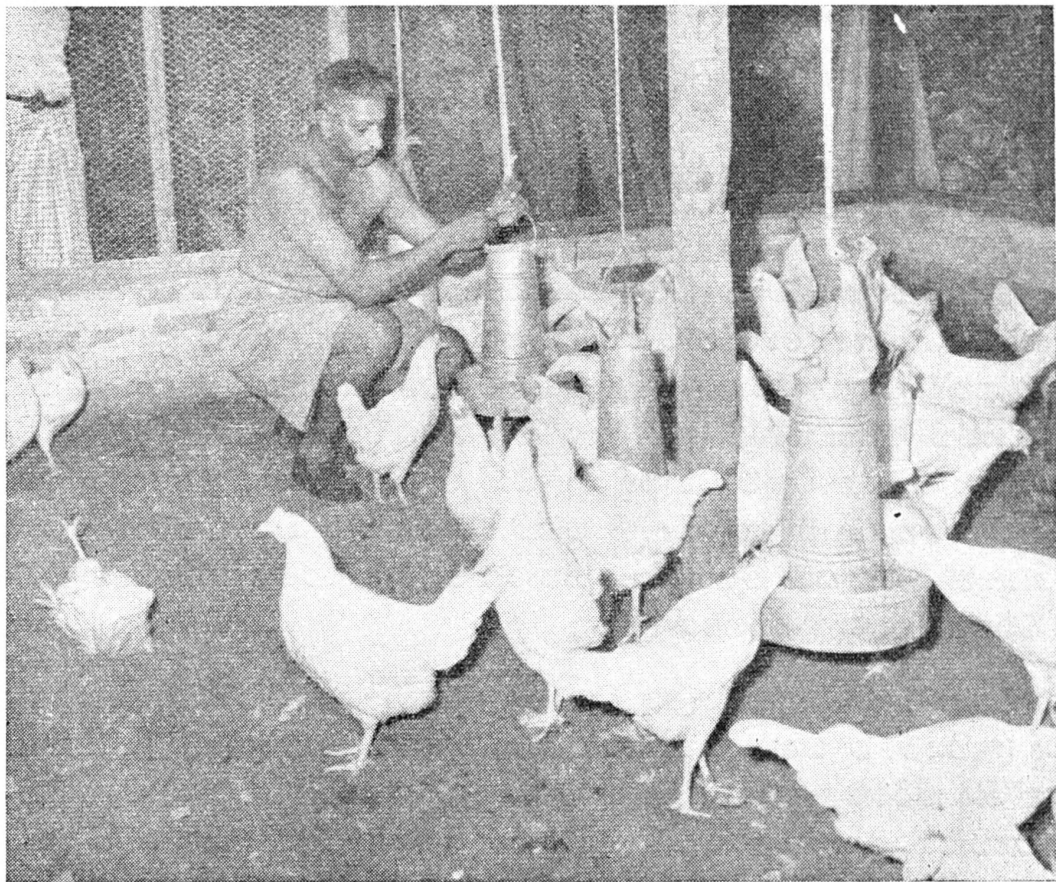
සමුපකාර ක්‍රමයේ කුකුළන්ට සත්කාර

ව්‍යාපාරය ආරම්භ කිරීම සඳහා පාන්දර ගොවිකම් ව්‍යාප්ති කොට්ඨාශයේ අරුක්ගොඩ, ගොරකාන, මොරවින්න, තොටවන්න, හා වාද්දුව යන ස්ථානවල ප්‍රනාන්දු මහතා විසින් කුකුළන් ඇති කිරීමේ සමුපකාර සමිති පහක් පිහිටුවන ලදී. එයින්, පසුගිය ජූනි මාසයේ ව්‍යාපාරයේ කටයුතු බැලීමට කළුතර දිස්ත්‍රික්ක යට අප ගියවිට, සාමාජිකයින් 91ක් දෙනෙකුගෙන් සමන්විත එම සමිති පහෙන්