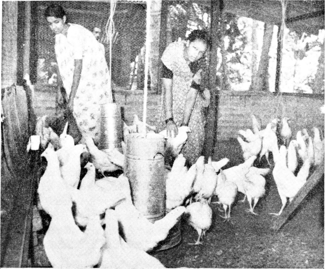
මෙම ක්‍රමයට කාන්තාවන්ගේද සහාය තිබෙයි

ආර්ථික නොවන්නේය. ඒ අතරතුර මැහැලි කිකිළියන් වෙනුවට අළුත් සතුන් පට්ටියේ දමා ගැනීම ගැන සාමාජිකයින්ගේ සිත් යොමු විය යුතුවෙයි මහජන බැංකුවේ ණය මුදල ගෙවීමද ඉහතින් සඳහන් මාස 18 කාල සීමාවට සීමා කර තිබෙයි.