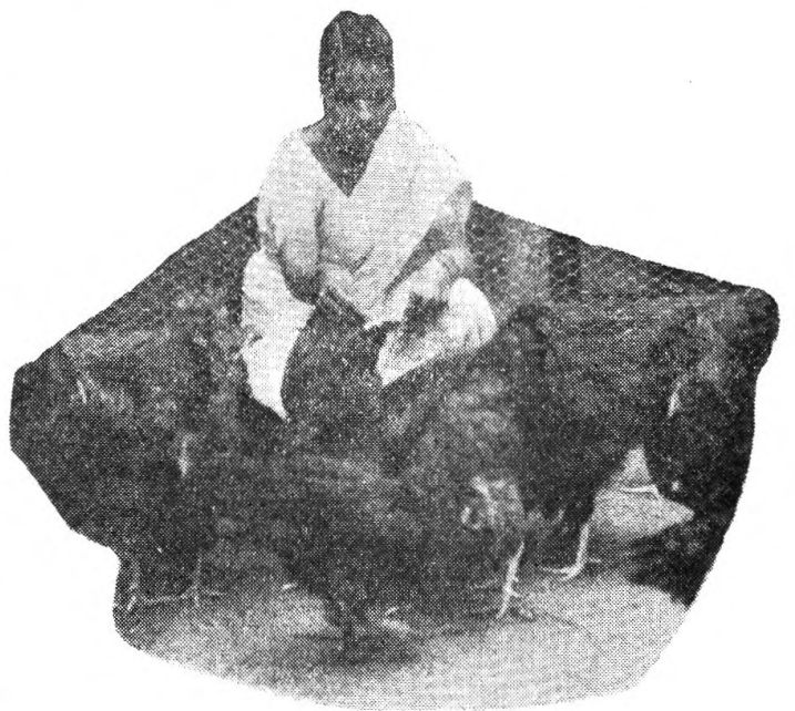
මුස්ලිම් මෙනෙවියක් හා ඇගේ කුකුල් රංචුව

මේවායේ භාවිතය කන්නයෙන් කන්නයම දියුණු වී ඇති බව ව්‍යාප්ති නිලධාරී මහතා ගෙන් හෙළි විය. පැළ සිටුවීම පළාතේ යොදන ඉතා ප්‍රසිද්ධ ගොවිතැන් ක්‍රමයකි. සාමාන්‍ය ක්‍රමයට හා පේලි ක්‍රමයට 1960/61 මාසී කන්නයට වගාවූ කුඹුරු ප්‍රමාණය සම්පූර්ණ කුඹුරු ප්‍රමාණයෙන් සියයකට අසුවකට අධික විය. පැළ සිටුවීම බහුලව