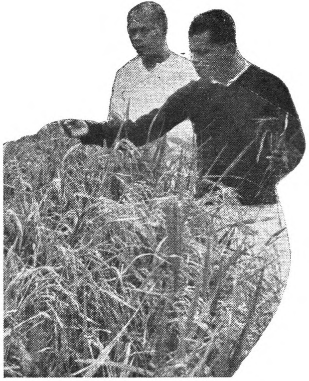
මාවනැල්ලේ පාර්ලිමේන්තු මන්ත්‍රී පී. ආර්. රත්නායක මහතා පුරුක් පණුවන් හානිකර බොල්ලු වි කරල් පරීක්ෂා කරයි.

නුමුහුන් වි වගාවේ ප්‍රයෝජනය මෙම පළාතේ ගොවීන්ට දැන් සවිස්තරව තේරී ඇත. පෙර නිබුණ නා නා වි වගී සහමුලින්ම නැතිව ඒ වෙනුවට දියුණු කළ නුමුහුන් වි වගී පමණක් වගාවෙන දිනය ඉතා මෑත අනාගතයේදී පැමිණෙන බව පෙන්වීමට කරුණු රාශියක් මෙහි තිබේ. 1960/61 මාස කන්නයට පී. ටී. බී. 16 නුමුහුන් වි අක්කර 2,000 ක්ද, පොඩිවි ඒ 8 අක්කර 700 ක්ද, මුරුංගාකායන් 302 අක්කර 500 ක්ද වගා කර ඇති නිසා ඉතිරිව ඇත්තේ තව කුඹුරු සුළු ප්‍රමාණයකි. මේ හැර එවි 4 නමැති