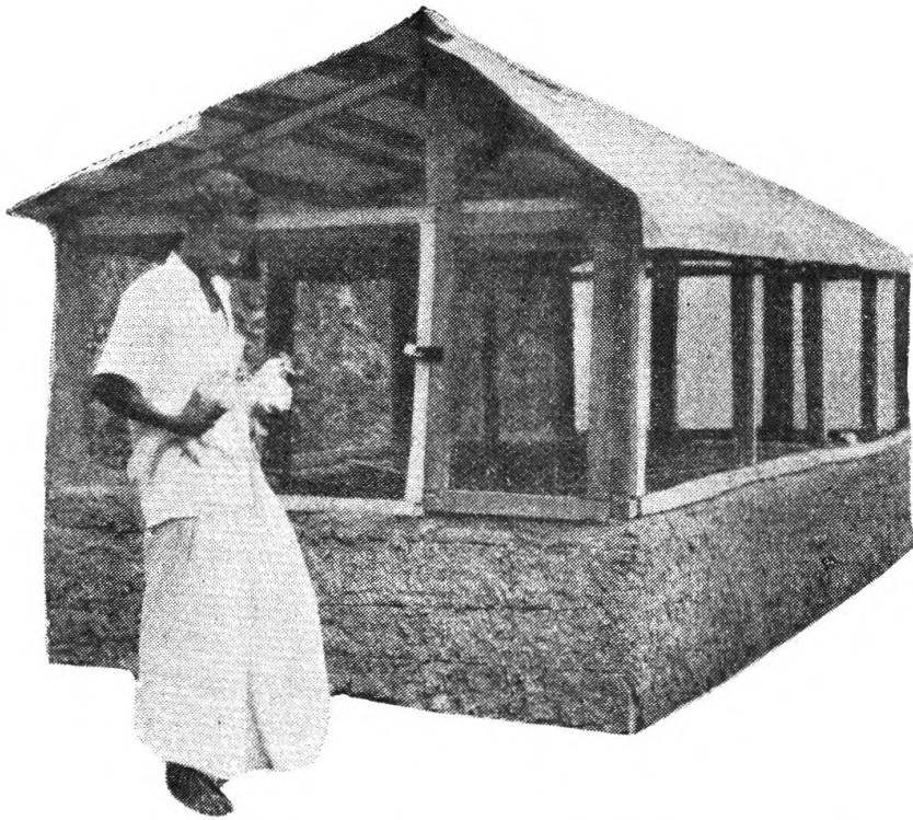
නිවසකට යාබද ඩිජිටල් ලිටර් කුකුල් ගෙයක්

අතර මධ්‍යම හා වෙනත් කුඩා ඉඩම්වල එම බෝග හැර වෙනත් සවිර බෝග රාශියක්ද මිශ්‍රව වැවී ඇත.