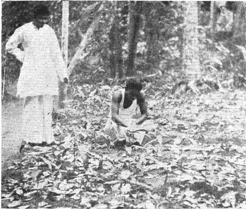
පරණකුරු කෝරළේ නැඟෙනහිර කොට්ඨාශයේ සාරවත් අඹ තට්ටු